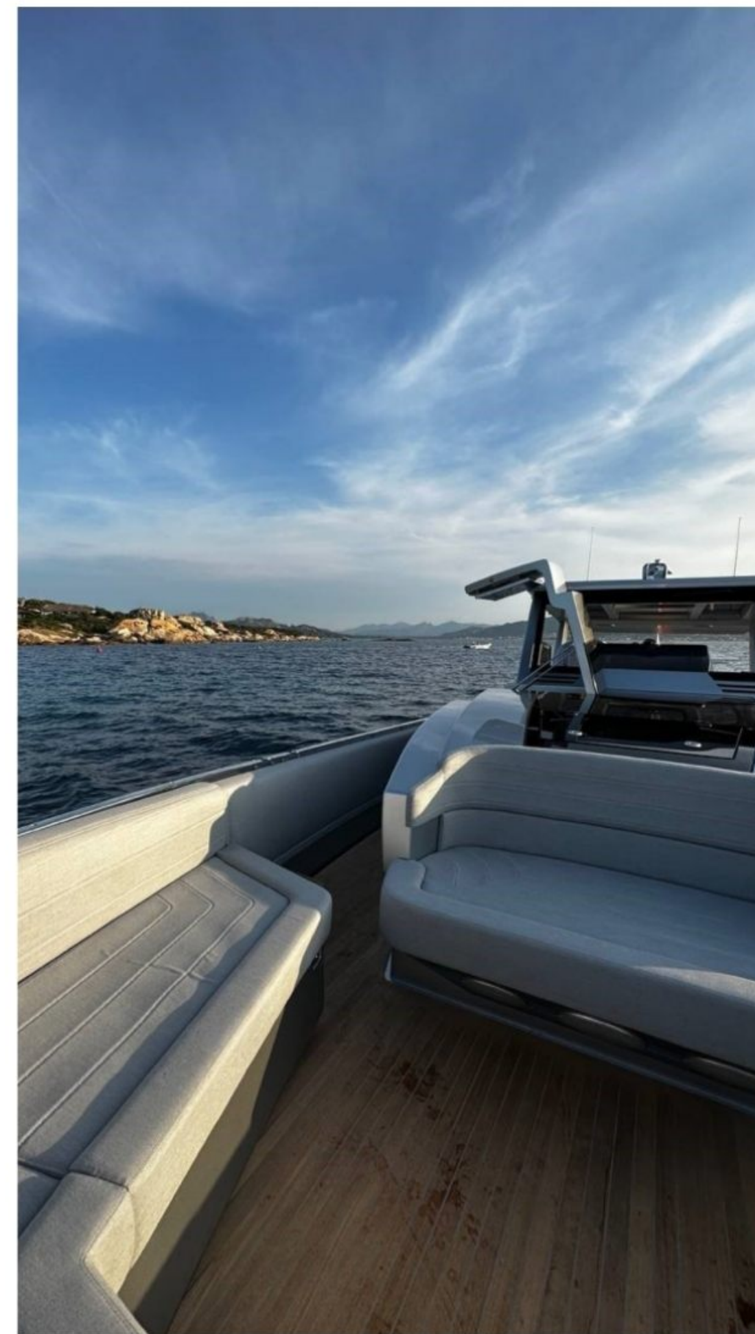
NOVAMARINE BLACK SHIVER 140 EGO