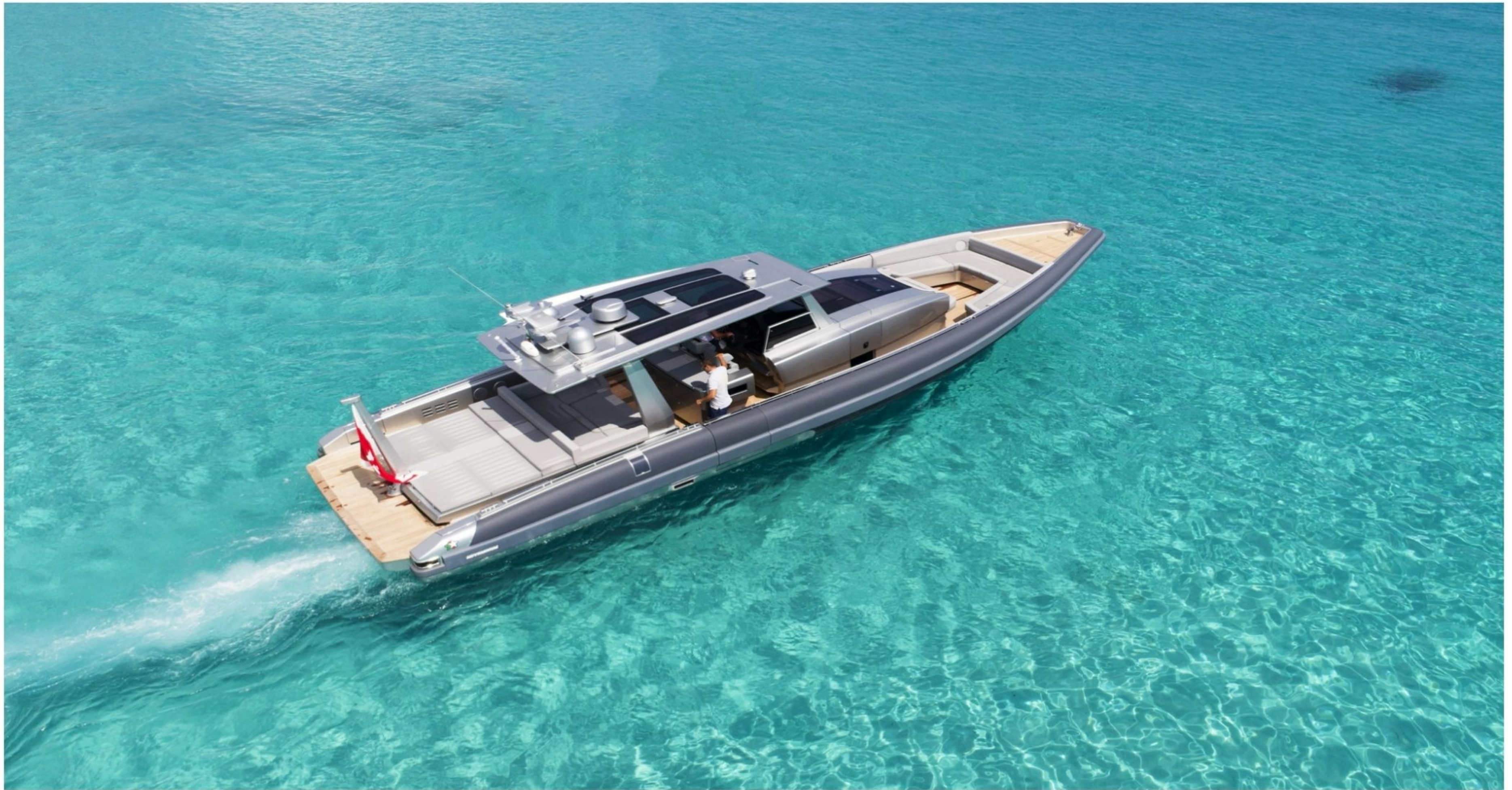
NOVAMARINE BLACK SHIVER 140 EGO